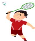
バドミントン同好会